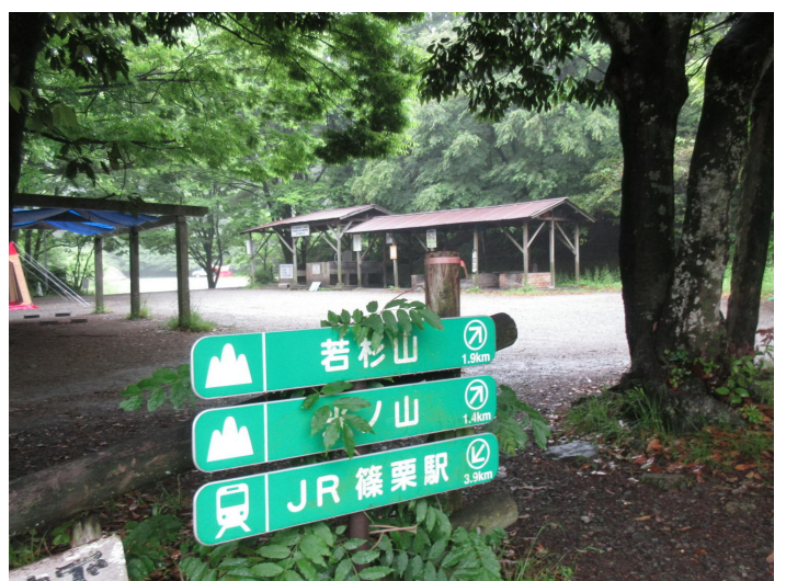
若杉の楽園（キャンプ場）。

若杉の楽園にはトイレや水場がある。そこから上の太祖院金剛頂院へ上がり、社殿の横から登山道へ入る。ここから先は杉の巨木巡り。様々な形をした杉の木が見られ楽しみながら上れる。