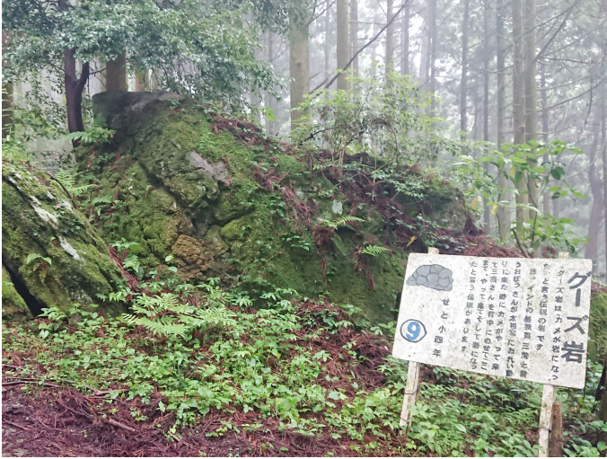
林道途中にあるグーズ岩