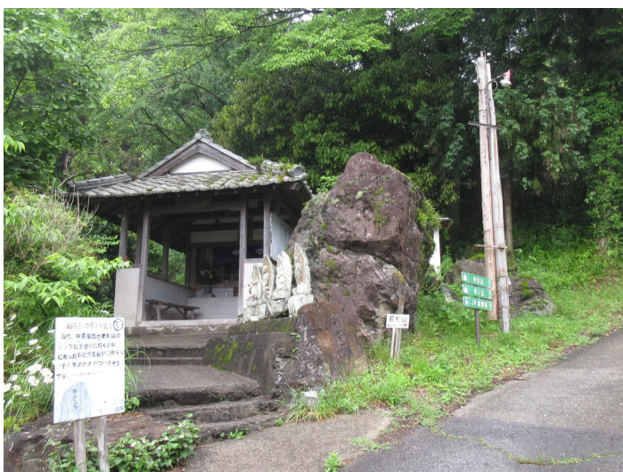
押石がある普門院跡。

ここでもよく整備された模擬ガンギの道で、暫しこの道を上がって行くと若杉の楽園に出会う。