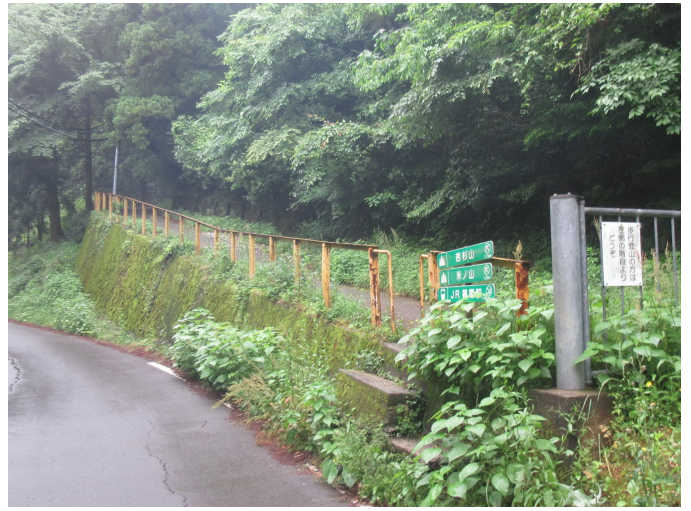
コンクリの道は若杉の楽園上部の林道に出る